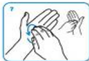
rotational rubbing, backwards and forwards with clasped fingers of right hand in left palm and vice versa.