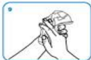
dry thoroughly with a single use towel