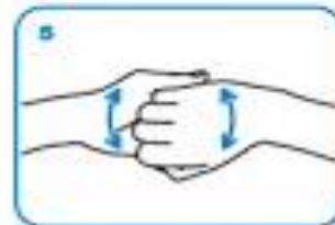
backs of fingers to opposing palms with fingers interlocked