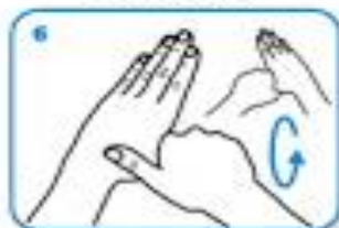
rotational rubbing of left thumb clasped in right palm and vice versa