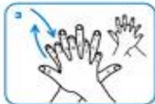
right palm over left dorsum with interlaced fingers and vice versa