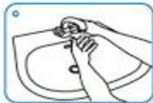
Wet hands with water

۱۰) دستمال را در سطل زباله درب دار بیندازید.