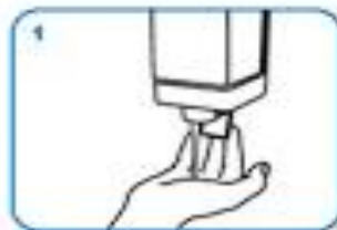
apply enough soap to cover all hand surfaces.