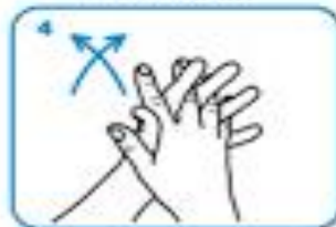
palm to palm with fingers interlaced