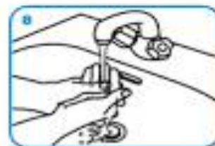
Rinse hands with water