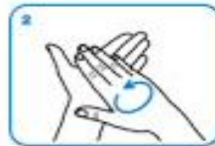
Rub hands palm to palm